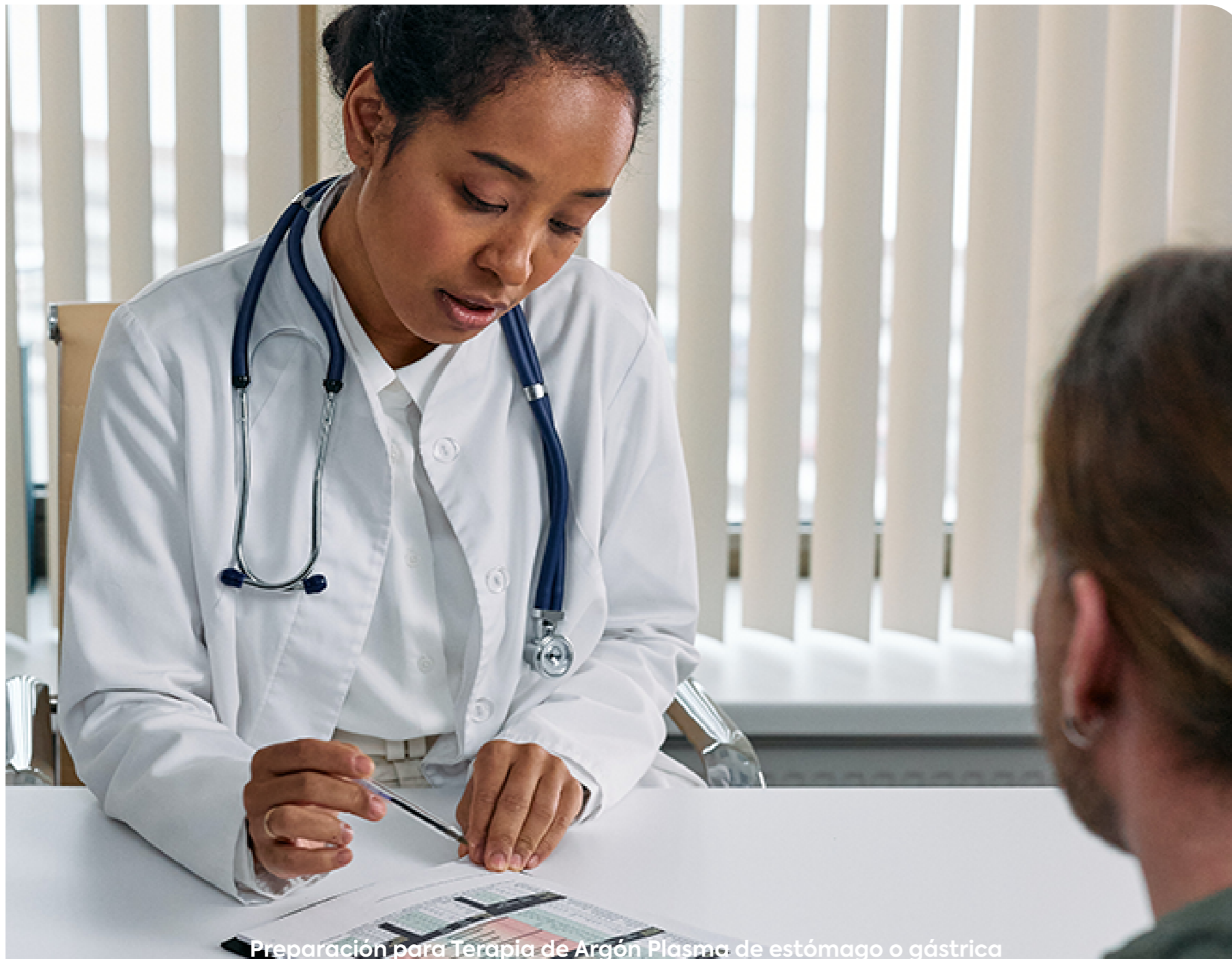
Preparación para Terapia de Argón Plasma de estómago o gástrica